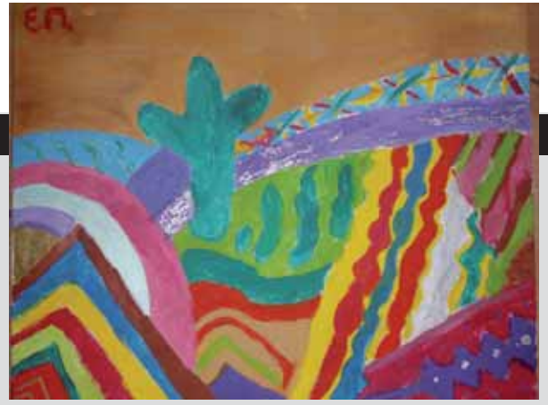
Η φωτογραφία του εξωφύλλου είναι ζωγραφιά τη Εύα Πανάγου

Ηλεκτρονική διεύθυνση www.diakrotima.gr • info@diakrotima.gr